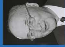
Jean Monnet (1888-1979)

Né allemand au Luxembourg, il est avocat et élu local à Metz à partir de 1912; à la fin de la première guerre mondiale, l'Alsace-Lorraine redevient française et Robert Schuman, français, entre au Parlement comme député de la Moselle jusqu'en 1940. Arrêté par la Gestapo, il s'évade et rejoint la zone libre. A nouveau député de la Moselle de 1946 à 1962, Président du Conseil puis Ministre des Affaires étrangères (1948-1952), il prononce la Déclaration du 9 mai 1950, rédigée par son ami Jean Monnet, qui lance la construction européenne. De 1958 à 1960, il est le premier président du Parlement européen, lequel lui décerne, à la fin de son mandat, le titre de "Père de l'Europe". Il se retire de la politique en 1962 et s'éteint un an plus tard, à 77 ans, à son domicile lorrain de Scy-Chazelles, devenu un musée et un centre d'activités européennes.