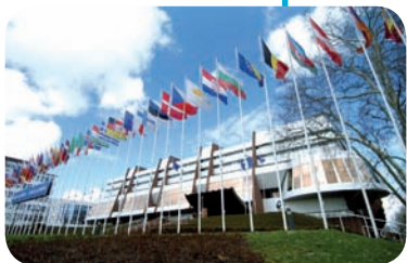
Conseil de l'Europe (Strasbourg)

1948 : Congrès de La Haye , principes d'une Europe politique et économique