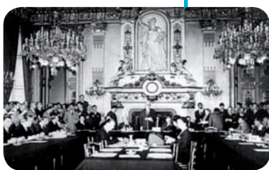
Salon de l'Horloge (Paris)